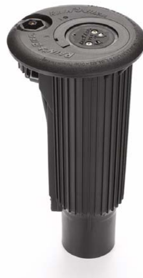
Rain Bird 700/751™