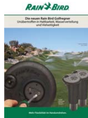
Rain Bird 700/751